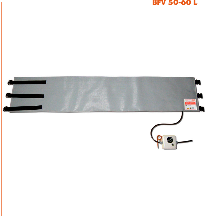
BFV 50-60 L